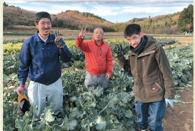
大変だけど楽しく作業してます