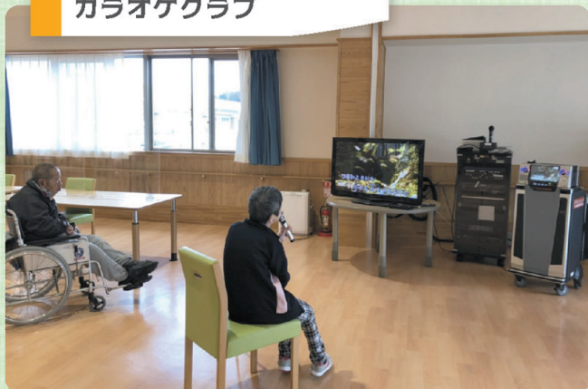
最新の通信カラオケ導入