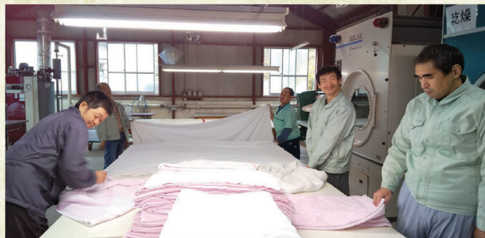
キレイに畳みます