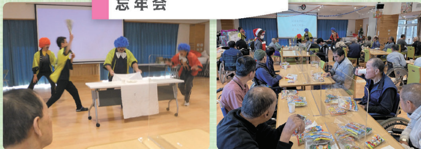
職員による余興披露