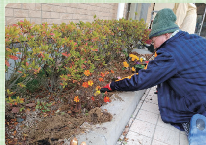
きれいに育ててね