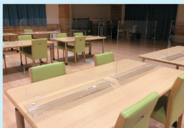
食堂テーブルにアクリル板を 設置しています