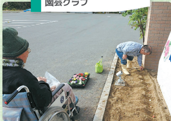
きれいな花を育ててます