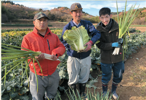
美味しい野菜を作ってます

施設に隣接した畑や施設外の畑で野菜を育てています。今年は新型コロナウイルス感染症により様々な制限もありましたが、栽培している野菜も立派に育ちました。これからも美味しい野菜を頑張って作っていきます。