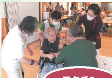
コロナワクチン接種