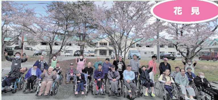
桜の木の下でハイチーズ