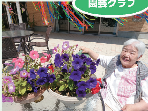
順調に育っています