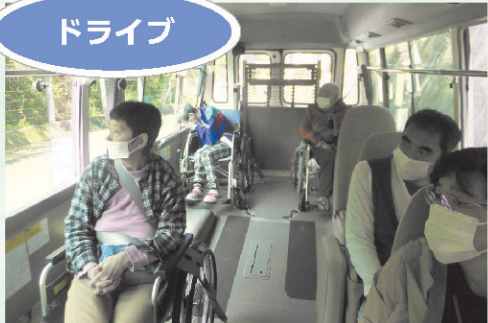
ガイドの話と景色に夢中です