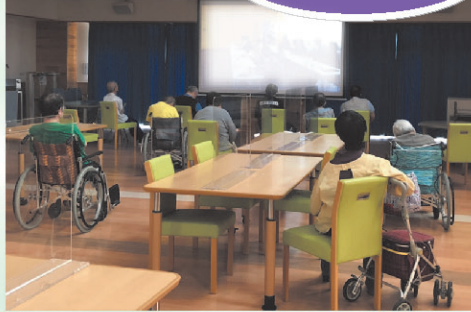
続きが楽しみです