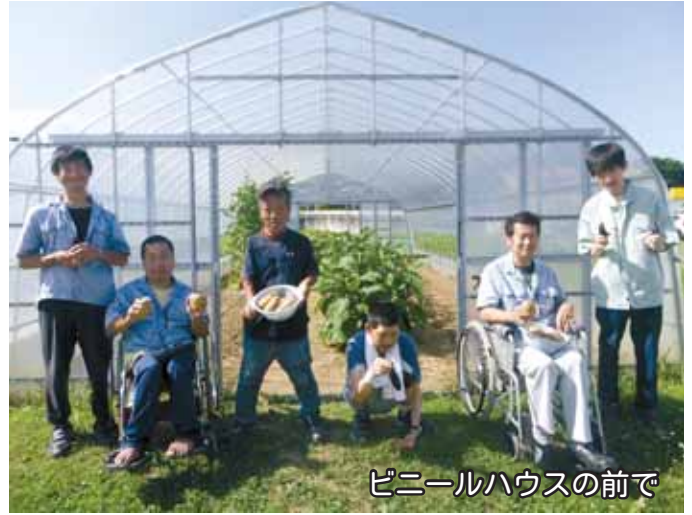
ビニールハウスの前で